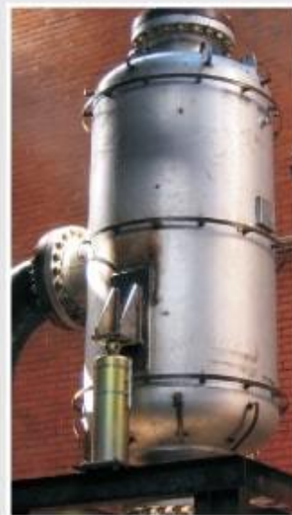
Balões Separadores de Vapor